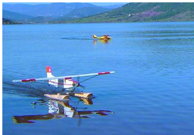
Hydravion au lac du Salagou

Les membres de l'AMVH pratiquent toutes les disciplines du modèle réduit : Avion, Planeur remorqué ou en vol de pente, Hélicoptère, Hydravion, électrique ou thermique.