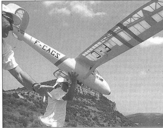
Trente-trois modélistes ont participé au concours.

Fair-play, le vainqueur de cette rencontre a cédé son trophée au plus jeune concu-